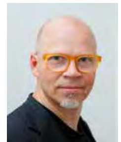
Kirjoittaja on toimittaja ja viestintäyrittäjä.

Nöyremmällä ja avoimemmalla otteella Oriola olisi jo voittanut sympatiat puolelleen. ■